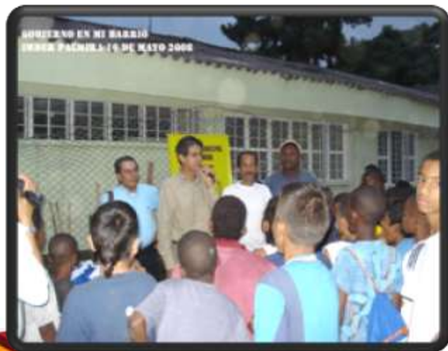
CORREGIMIENTO TIENDA NUEVA URBANIZACION RIO NIMA