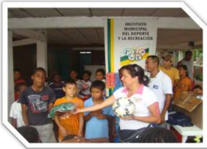
BARRIOS 20 DE JULIO VILLA DEL ROSARIO SIMON BOLIVAR